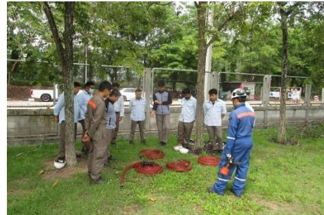
Basic Fire Fighting