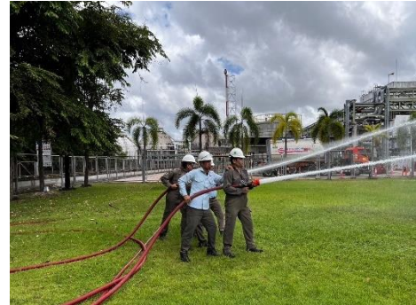
Basic Fire Fighting