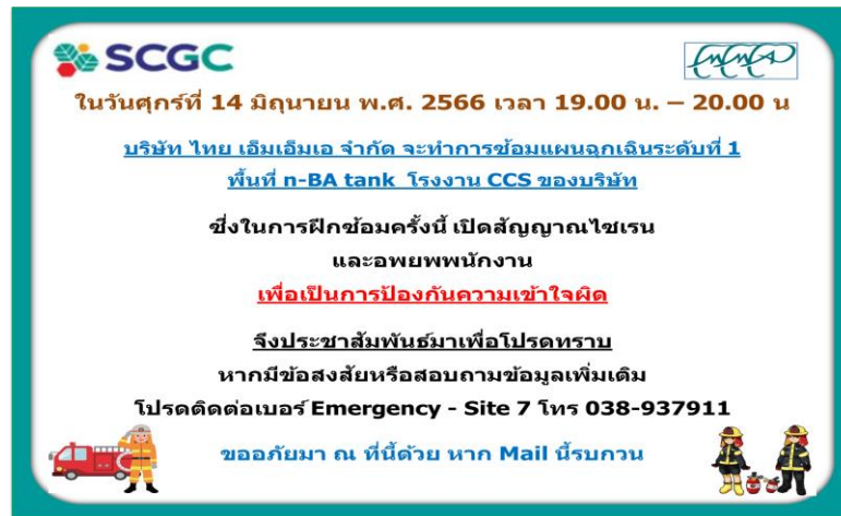
Basic Fire Fighting